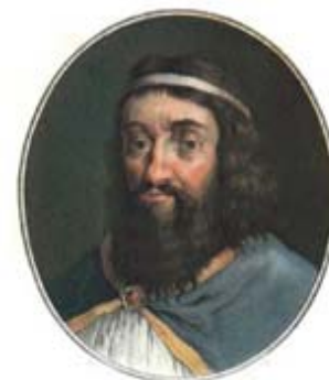
Carlos Magno (742-814)

A Igreja celta na Irlanda e na Escócia foi acima de tudo uma Igreja missionária. Culturalmente a igreja irlandesa de Patrício e Columba brilhou muito no norte da Europa entre 590 e 800. Estudiosos e missionários formavam uma corrente que partia da Irlanda, passava pela Inglaterra e ia até o continente, e até mesmo para além das fronteiras do Império de Carlos Magno (742-814). Este “bárbaro cristianizado” foi em alguns aspectos um segundo Constantino, e seu poder político não foi igualado na Europa ocidental durante meio milênio. Ele, porém, mostrou-se superior a Constantino em diversas áreas, havendo patrocinado diligentemente um número muito maior de atividades cristãs. O fato de os grandes centros de estudo