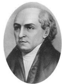
William Carey (1761-1834)

A despeito da imensa tarefa com a qual se defrontava na Índia, o “Trio de Serampore” tinha confiança no Deus que havia conduzido seus distantes ancestrais, também “escravos da superstição”, à genuína fé em Cristo. Trinta anos antes, em 1792, Carey fizera um número de referências a tal evangelização das Ilhas Britânicas em sua obra que marcou época, Uma Investigação Sobre o Dever dos Cristãos de Empregarem Meios para a Conversão dos Pagãos . 2 Carey lembrou aos crentes ingleses de seus dias, especialmente aos seus irmãos batistas particulares, que os cristãos de séculos atrás “não aguardaram que os antigos [germanos, gauleses e bretões] se tornassem civilizados para então serem cristianizados, mas foram avante apenas com a doutrina da cruz”. O nome de Patrício (c. 389-461) foi um dos que receberam mais atenção no livro de Carey: “No próximo ano Patrício foi enviado da Escócia para pregar aos irlandeses, que eram antes do seu tempo totalmente incivilizados, e, alguns dizem, canibais; ele, contudo, foi profícuo, e lançou os alicerces para diversas igrejas na Irlanda”. 3 Conquanto os fatos históricos indicados por Carey na sua obra não fossem todos rigorosamente corretos, isto indica que o êxito