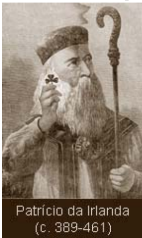
Patrício da Irlanda (c. 389-461)

Em tal contexto aconteceu algo de muita importância para a história do cristianismo das Ilhas Britânicas. Digno de especial menção é o homem que figura na história com o nome de “São Patrício”, e que foi denominado “o apóstolo e patrono da Irlanda”. Envolto em muitas